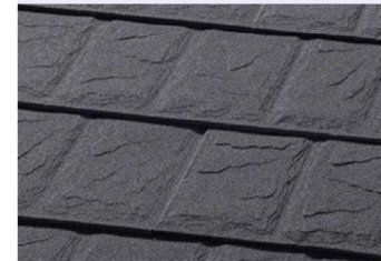
ストーンチップ (勘合)