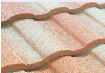
ストーンチップ (かぶせ)