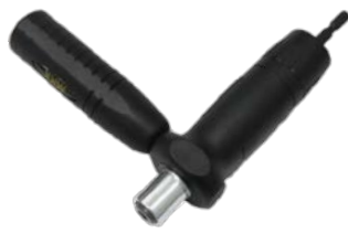
ルーフトポルト締ホルダー